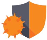
Antivirus y antimalware