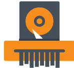
Destructor de datos