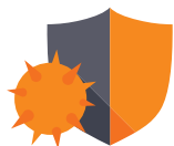
Antivirus y antimalware

Avast proporciona soluciones de seguridad empresarial locales y en la nube de administración sencilla para PC, Mac y servidores. Protegemos más de 230 millones de puntos de acceso globalmente, para ofrecer a su organización la seguridad más fiable del mundo.